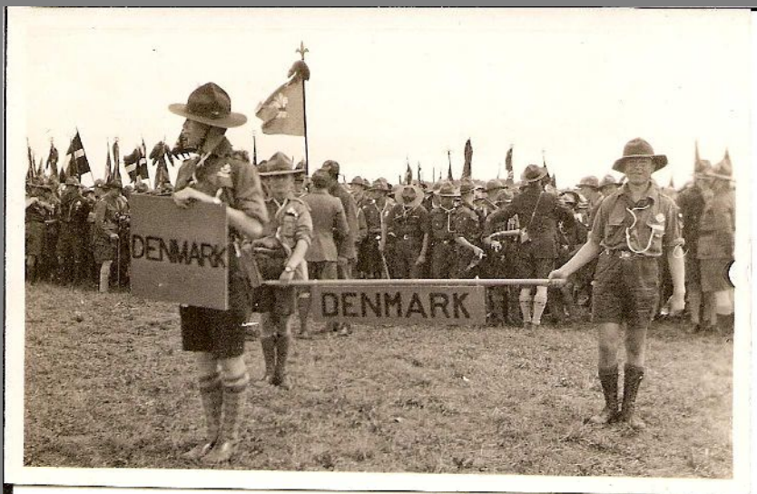
Danmarks Nationalitetsskilte, der blev baaret foran til Oplysning om hvem det er der passerer forbi.