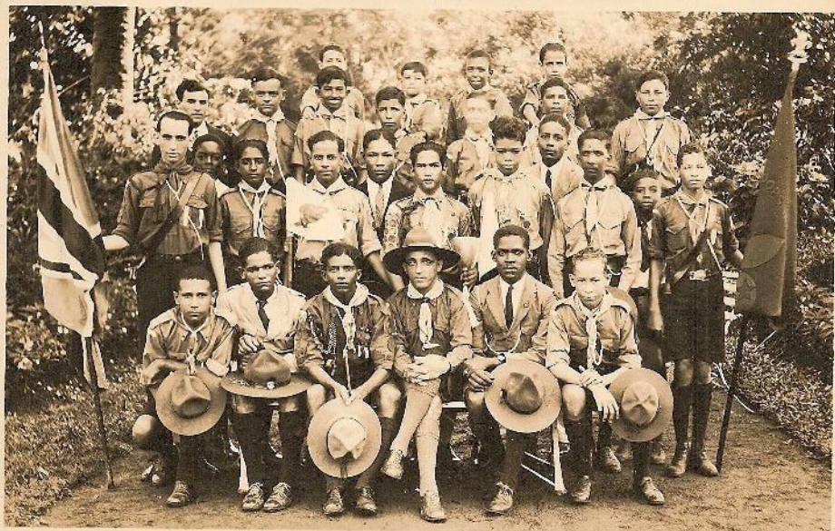
Dette er en Troop fra Britisk Guiana. Byen Alberttown.