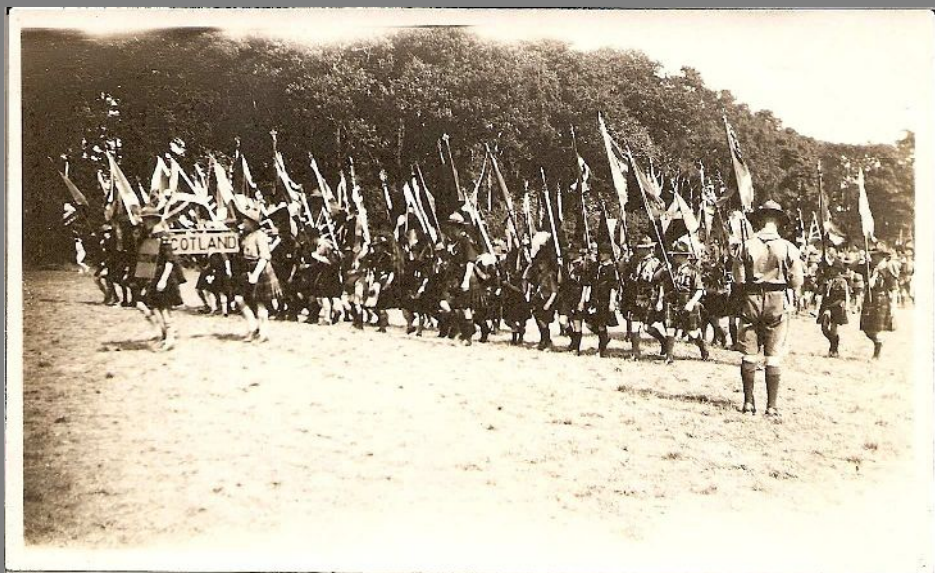
Skotlands Front med Skilte og Faner.